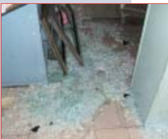
Destruction de la station thermique par la direction. Elle a appelé ça « démontage ».