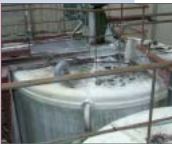
La cuve à craie sabotée par les bons soins de la direction.

La volonté de nos camarades est un élément moteur de notre action, le projet chanvre, véritable chapitre de la charte papetières de la Filpac Cgt, doit être porté, débattu par nos équipes syndicales, et sa faisabilité doit être étudiée, partout où il pourrait être synonyme d'emploi et développement, avec toutes les structures professionnelles et territoriales de la Cgt. ●