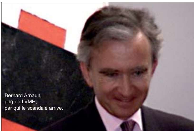
Bernard Arnault, pdg de LVMH, par qui le scandale arrive.

C'est un premier acquis dans lequel se sont d'ailleurs immé-