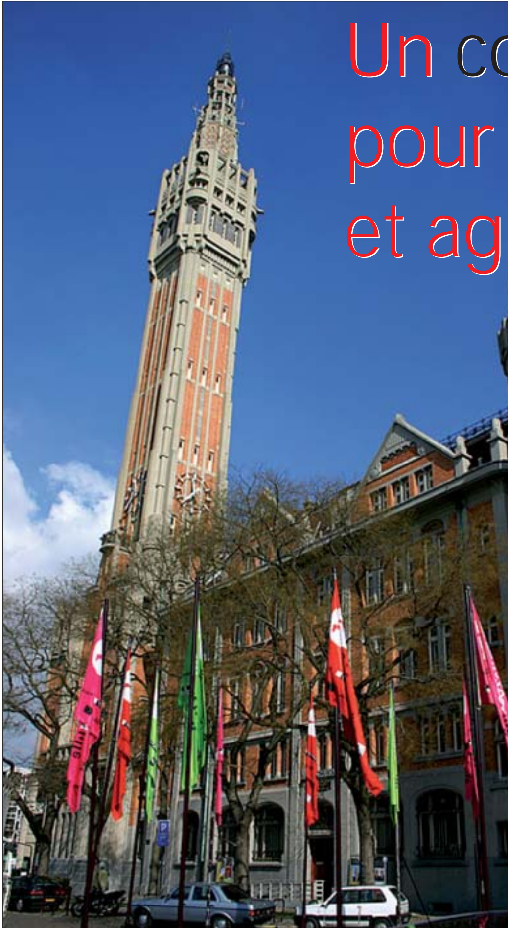
Le grand Beffroi de Lille